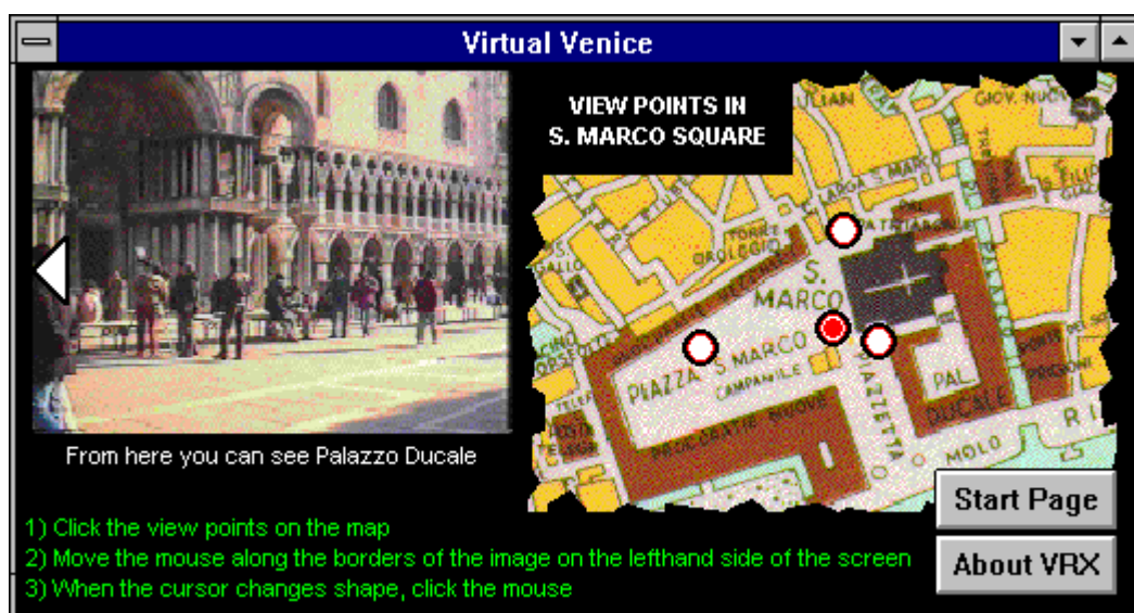
Figura 2. Il dimostrativo Virtual Venice incorpora il modulPlayer di VRXplorer

La seguente illustrazione riporta la schermata principale del dimostrativo Virtual Venice , ove ad una mappa di Piazza San Marco a Venezia sono state associate una serie di panoramiche virtuali nelle quali e' possibile spostarsi in una qualsiasi delle direzioni desiderate.